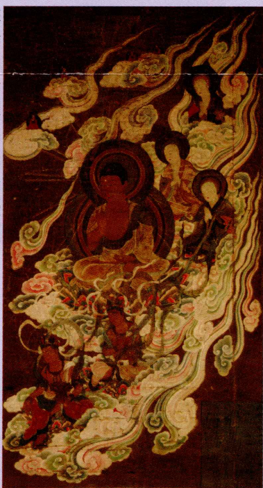
往生する人を迎えに来る阿弥陀仏 〈阿弥陀聖衆来迎図〉

往生を信じて、お念仏を称えれば、誠の心が具わる。それは、亡くなった人に会いたいと思つて南無阿弥陀仏を称えることで、いつか再会ができるということでもあります。どうぞ、良い往生際を目指して、お念仏をお称えいたしましょう。