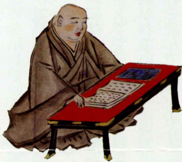
法然上人絵伝

本年は、そのことを慶ぶための多くの法要や行事が営まれています。機会がありましたらぜひご参加いただき、その歴史やお念仏の教えのありがたさを感じてください。